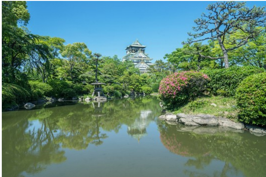
株DAN 総合設計 研修旅行 2022 大阪

長時間行動を共にする事で、会社組織としてコミュニケーションを図り、お互いの長所・短所の見直しのきっかけとして下さい。普段業務の中で、段取りをする幹事さん一人任せでは無く、皆が気持ち良く旅行をする為には、協力し合いサポートする事が必要不可欠です。個々が旅行の役割を自身で考え、全体で動いていることを意識して臨んで下さい。旅行中で生じた問題点を反省し、それらを蓄積して旅行前にその一つ一つの事項を再確認し周知、徹底することで、次回の有意義な研修旅行が出来るように意識していきましょう。