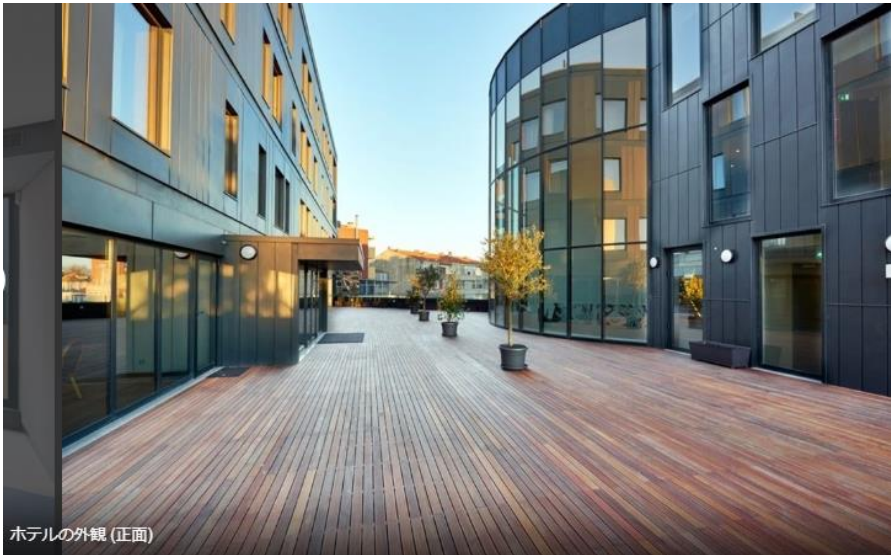
ホテルの外観 (正面)