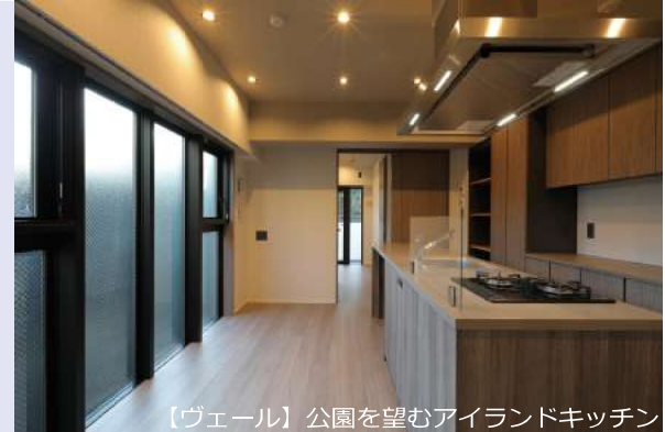
【ヴェール】公園を望むアイランドキッチン

隣地する敷地に建つツインレジデンスである。それぞれの棟は【シエル】【ヴェール】と名付け、目の前に広がる桜の景勝公園を望める。敷地特性に合わせ【シエル】は中廊下型を採用し明確に住環境を区別することに成功し、【ヴェール】はアイランドキッチンから公園を望めるなど個性的なプラン構成を採用している。 更に公園を取り込むためバルコニーサイズを通常より大きくし照明を設置し部屋の延長として付加価値を高めている。エントランスや共用部は木を感じながらも高級感を演出している。通常分譲マンションには無い駐車場・駐輪場を兼用としツインレジデンスならではの試みも行われている。 その佇まいはまさしく地域性を捉えたYOKOHAMAの【海】と【緑】を象徴している