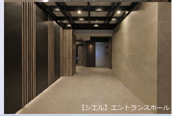
【シエル】エントランスホール