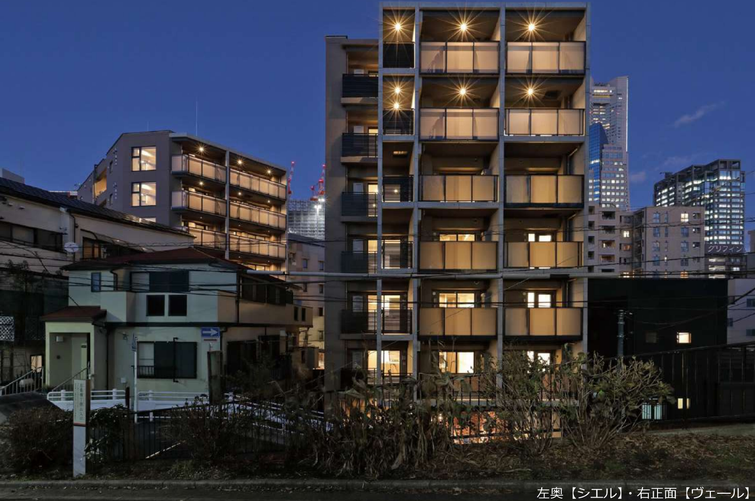
左奥【シエル】・右正面【ヴェール】