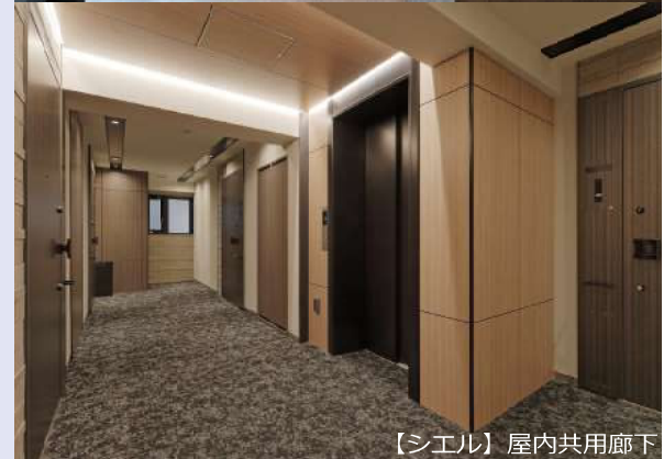
【シエル】屋内共用廊下