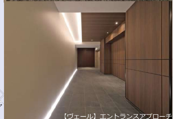
【ヴェール】エントランスアプローチ